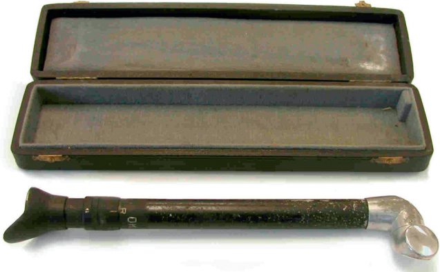
Figura 1 Fluoroscopio intraoral (cortesía de Paul Frame de Oak Ridge Associated Universities).

El objetivo de los fluoroscopios orales era proporcionar un dispositivo adaptado que permitiese al profesional observar con seguridad y de forma instantánea las condiciones normales y patológicas de las estructuras de los arcos dentales y de las adyacentes a los tejidos blandos, que tienen