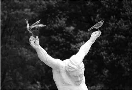
1º Premio: "En las manos de Cristo", de Ignacio Letche.

Aprovechamos la ocasión para invitarlos a participar del concurso fotográfico del 2012: "Lluvia en mi ciudad" . Para mayor información pueden consultar la página web de la SAR: www.sar.org .