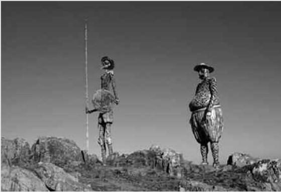
3º Premio: "Tandil, lugar soñado", de Nicolás de Martino.