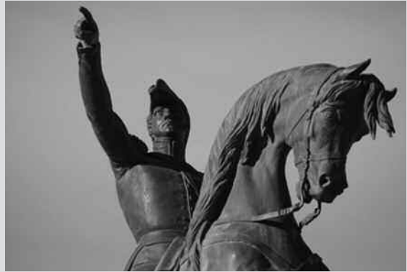
2º Premio: "Lib. Gral. San Martín", de Ezequiel Lampe.