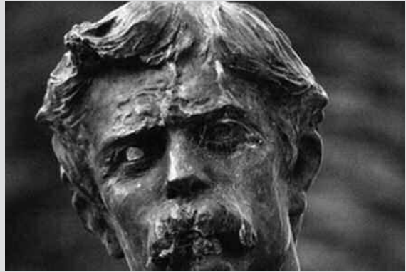
Mención especial: "Retrato", de Ignacio Letche.