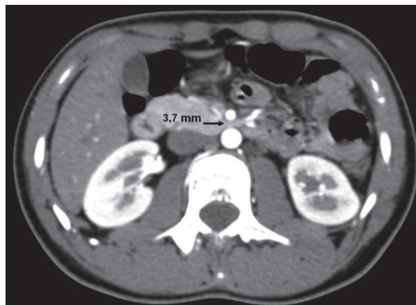
Figura 1 Tomografía computada con contraste endovenoso de la paciente: se muestran los cortes axiales en fase arterial. La medición de la distancia aorta-arteria mesentérica superior se encuentra disminuida (3,7 mm).

Hay una serie de elementos que predisponen el desarrollo de este síndrome: condiciones asociadas a la pérdida severa de peso (cáncer, sida, parálisis cerebral o abuso de