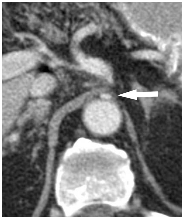
Figura 3 Signo del moño y la mantilla en el síndrome del ligamento arcuato mediano del diafragma: corte tomográfico convencional en plano axial del mismo paciente donde se aprecia el tronco celíaco comprimido y deformado entre la aorta abdominal ubicada dorsalmente y el ligamento arcuato mediano localizado ventralmente (flecha). Este último rodea prácticamente a los otros. (Tomado de Soliva Martínez D, Fernández Iglesias P, Belda González I, Martínez Yunta JA, Hernández Muñoz L, Blanco López ME. Hallazgos poco conocidos en el síndrome del ligamento arcuato mediano. 10.1594/seram2014/S-0407).

La clínica inespecífica y su desconocimiento, pese a la alta prevalencia de la disposición anatómica descrita, hacen que esta entidad sea poco sospechada en la práctica clínica diaria, por lo que usualmente no se realizan por protocolo reconstrucciones multiplanares sagitales (TCMD), ni angiografías por TC, ni arteriografías dirigidas a su diagnóstico.