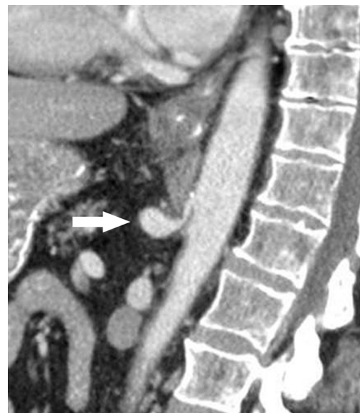
Figura 1 Reconstrucción en plano sagital (TCMD) en inspiración forzada. Impronta del ligamento arcuato mediano sobre el origen del tronco celiaco, estenosando su luz y dándole la típica morfología en "gancho", con dilatación postestenótica asociada (flecha): síndrome del ligamento arcuato mediano. (Tomado de Soliva Martínez D, Fernández Iglesias P, Belda González I, Martínez Yunta JA, Hernández Muñoz L, Blanco López ME. Hallazgos poco conocidos en el síndrome del ligamento arcuato mediano. 10.1594/seram2014/S-0407).

Para el diagnóstico de este síndrome, es necesario confirmar la compresión del origen del tronco celiaco por parte del